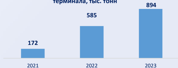
Динамика объемов перевалки карбамидного терминала, тыс. тонн

Пропускная способность до 1,5 млн тонн в год