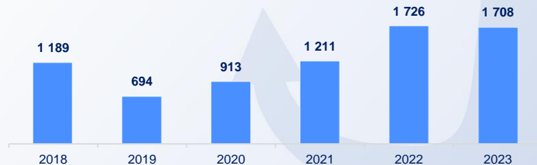
Динамика перевалки объемов сухих грузов, тыс. тонн