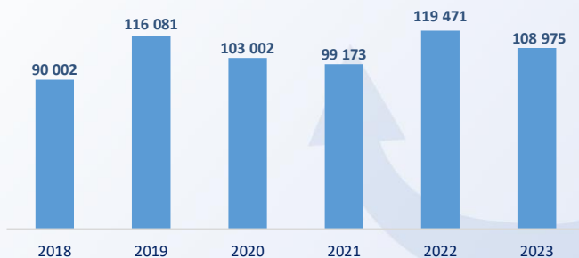
Динамика объемов перевалки контейнерных грузов, TEU

Центральное географическое расположение и естественная глубоководная гавань делают Батумский международный контейнерный терминал (ВICT) воротами для перевозки контейнерных и генеральных грузов на Кавказ и в Центральную Азию.