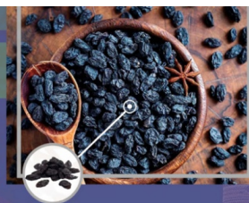
SAYAKI BLACK RAISINS